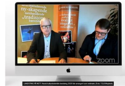
Norsk kulturskoleråds landsting: Protokollen signert og offentliggjort